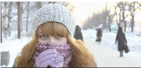
У бліжэйшыя дні чакаецца зімовы характар надвор'я.