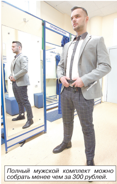
Полный мужской комплект можно собрать менее чем за 300 рублей.